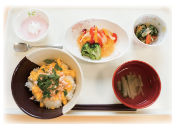
行事食例(4月お花見)