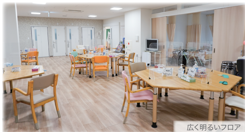
広く明るいフロア