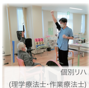
個別リハ (理学療法士・作業療法士)